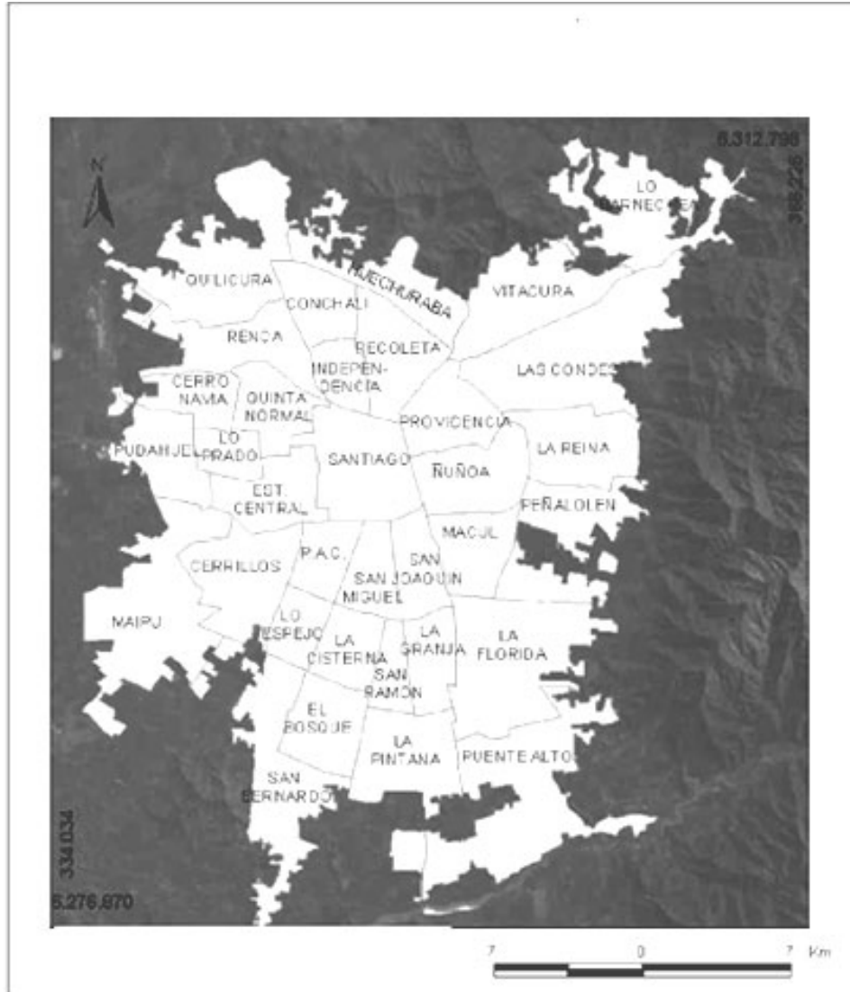
Figura 1. Área Metropolitana de Santiago